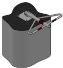
SŁUPEK TYPU „MOTYL”